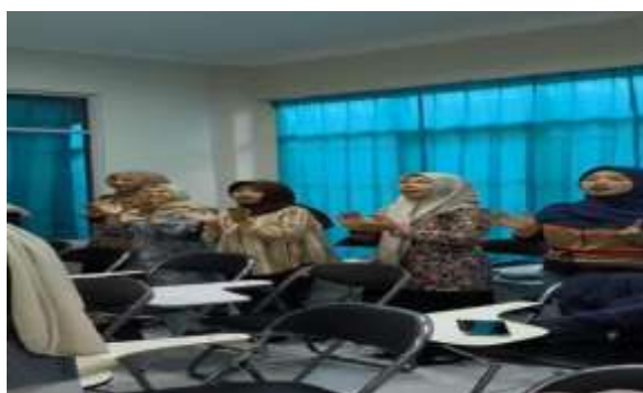
Gambar 3. Sesi Simulasi Kegiatan

mendemonstrasikan beberapa teknik ice breaking seperti permainan konsentrasi, tepuk semangat, simulasi komunikasi kelompok, permainan kerja sama tim, dan aktivitas pengenalan diri kreatif. Mahasiswa kemudian dibagi ke dalam beberapa kelompok kecil untuk mempraktikkan langsung teknik-teknik tersebut secara bergantian. Dalam sesi ini, mahasiswa dilatih untuk berani tampil di depan kelompok, membangun komunikasi yang efektif, serta menciptakan suasana yang menyenangkan dalam kegiatan belajar. Simulasi dilakukan secara interaktif sehingga seluruh peserta terlibat aktif dalam setiap aktivitas yang diberikan. Melalui praktik langsung tersebut, mahasiswa dapat memahami bagaimana teknik ice breaking mampu mengurangi ketegangan, meningkatkan semangat belajar, serta memperkuat koneksi emosional antar mahasiswa.