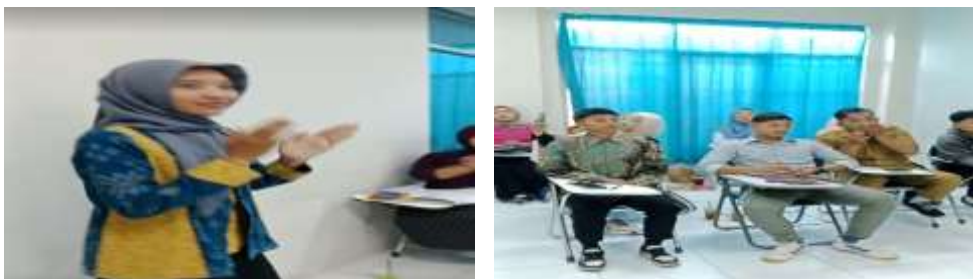
Gambar 2. Sesi pembukaan

Pelaksanaan pelatihan penerapan teknik ice breaking dalam membangun koneksi emosional mahasiswa di STAI Muhammadiyah Blora diawali dengan sesi pembukaan yang bertujuan untuk menciptakan suasana yang hangat, nyaman, dan kondusif bagi seluruh peserta. Pada tahap ini, panitia dan pemateri memberikan sambutan serta penjelasan mengenai tujuan, manfaat, dan rangkaian kegiatan pelatihan yang akan dilaksanakan. Mahasiswa diberikan motivasi mengenai pentingnya komunikasi interpersonal, kerja sama, dan hubungan emosional dalam mendukung keberhasilan proses pembelajaran di perguruan tinggi. Selain itu, pemateri juga menjelaskan bahwa kegiatan pelatihan ini dirancang untuk membantu mahasiswa menjadi lebih aktif, percaya diri, dan mampu membangun interaksi positif di lingkungan akademik. Untuk mencairkan suasana awal kegiatan, peserta diajak mengikuti ice breaking sederhana berupa permainan perkenalan dan aktivitas kelompok ringan sehingga mahasiswa mulai merasa nyaman dan lebih siap mengikuti pelatihan secara aktif.