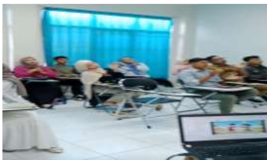
Gambar 6. Pemutakhiran Pelatihan

Pemutakhiran pelatihan dilakukan sebagai upaya pengembangan dan penyempurnaan program pelatihan penerapan teknik ice breaking di STAI Muhammadiyah Blora. Berdasarkan hasil evaluasi, beberapa teknik ice breaking yang dinilai efektif akan terus dikembangkan dan disesuaikan dengan kebutuhan mahasiswa serta situasi pembelajaran yang berbeda. Selain itu, materi pelatihan akan diperbarui dengan menambahkan variasi aktivitas yang lebih kreatif, inovatif, dan sesuai dengan perkembangan metode pembelajaran modern. Pemutakhiran juga dilakukan dengan memperhatikan masukan dari peserta pelatihan mengenai jenis kegiatan yang paling menarik dan bermanfaat dalam membangun koneksi emosional. Dengan adanya proses pemutakhiran ini, pelatihan diharapkan mampu menjadi program yang berkelanjutan dalam mendukung pengembangan kemampuan komunikasi, kerja sama, dan interaksi sosial mahasiswa di lingkungan STAI Muhammadiyah Blora