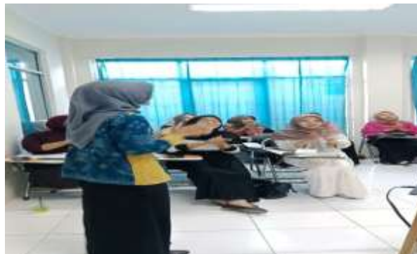
Gambar 6. Sesi Penutupan dan evaluasi

Pada sesi penutup, pemateri memberikan penguatan materi mengenai pentingnya penerapan teknik ice breaking dalam membangun koneksi emosional mahasiswa di lingkungan pembelajaran. Mahasiswa diberikan motivasi agar mampu menerapkan berbagai teknik yang telah dipelajari dalam kegiatan akademik, organisasi, maupun interaksi sehari-hari di kampus. Selain itu, dilakukan evaluasi kegiatan melalui observasi partisipasi mahasiswa, respon peserta selama pelatihan, serta diskusi singkat mengenai manfaat yang dirasakan setelah mengikuti kegiatan. Hasil evaluasi menunjukkan bahwa mahasiswa menjadi lebih aktif, komunikatif, dan percaya diri selama proses pelatihan berlangsung. Sebagian besar peserta juga menyampaikan bahwa kegiatan ice breaking membantu mereka merasa lebih nyaman dan mudah berinteraksi dengan teman-teman lainnya. Evaluasi ini digunakan sebagai bahan perbaikan untuk pelaksanaan pelatihan berikutnya agar kegiatan dapat berjalan lebih efektif dan memberikan manfaat yang lebih luas bagi mahasiswa.